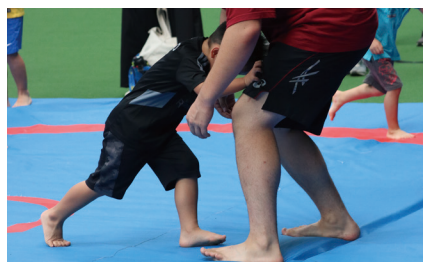
みんな楽しくキャットバンド！（レスリング部）