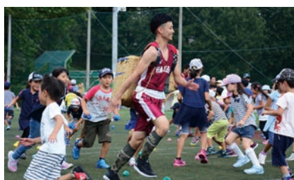
ALL WASEDA 玉入れ大会