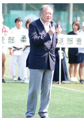
丸山浩一西東京市長