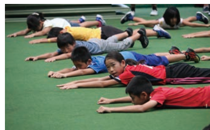
速く泳ぐための陸上トレーニング (水泳部)