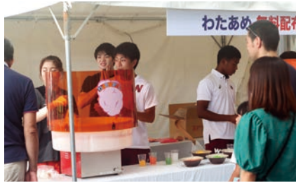
わたあめサービス