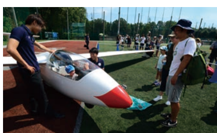
グライダー体験搭乗! (航空部)