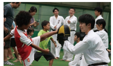
空手をやってみよう（空手部）