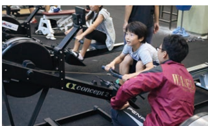
わくわく！ボート体験！（漕艇部）