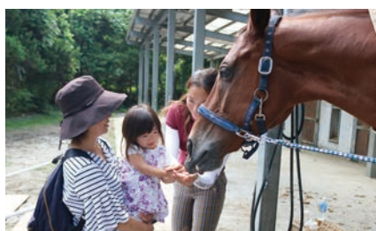
馬とふれあおう!エサやり体験 (馬術部)