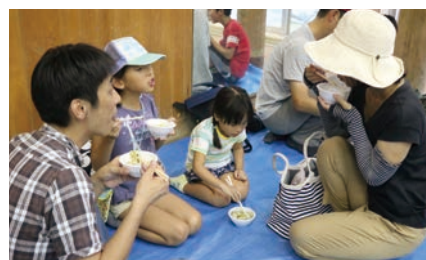
ちゃんこフェス2018（相撲部）