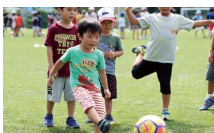
東伏見サッカー教室 (ア式蹴球部)