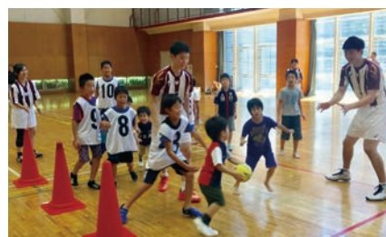
ハンドボール教室（ハンドボール部）