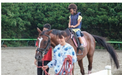
馬とふれあおう!ジュニア乗馬体験 (馬術部)