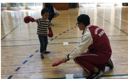
ボクシング体験！（ボクシング部）