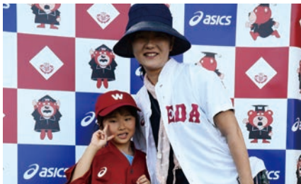
アシックスジャパン株式会社

ご協賛各社様よりブースの出展をいただきました。早稲田大学と連携するアシックスジャパン(株)様のブースでは、様々な早稲田大学とのコラボレーショングッズ販売と、野球やサッカーのユニフォームを着ての記念撮影、西東京稲門会様のブースでは輪投げが行われました。また、大塚製薬(株)様のブースでは来場者に熱中症対策としてポカリスエットが無料で配られました。その他、東伏見商栄会様をはじめとする多数の飲食ブースやキッチンカーが並び、賑やかで楽しい会場となりました。