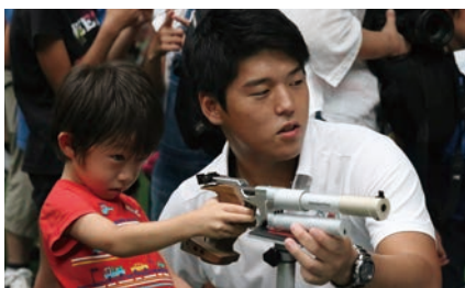
ライフルシューティング体験（射撃部）