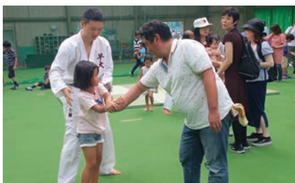
親子で学べる合気道護身術 (合気道部)