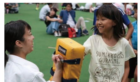
必技 少林寺拳法！！（少林寺拳法部）