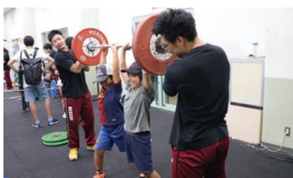
ウェイトリフティング体験教室（ウェイトリフティング部）