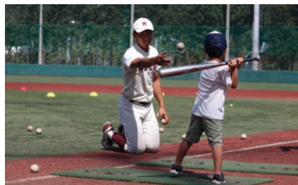
野球を楽しもう！（野球部）