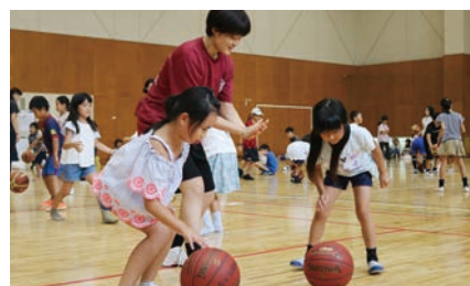
ステップ、ジャンプ、シュート！（バスケットボール部）