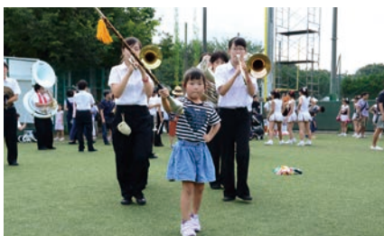
応援部 1 日体験 (応援部)