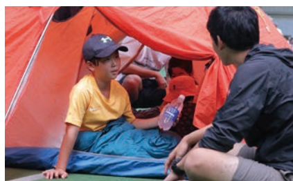
キャンプ体験！（ワンダーフォーゲル部）