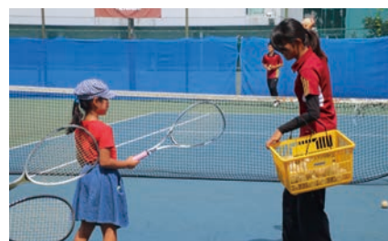
ソフトテニス教室 (軟式庭球部)