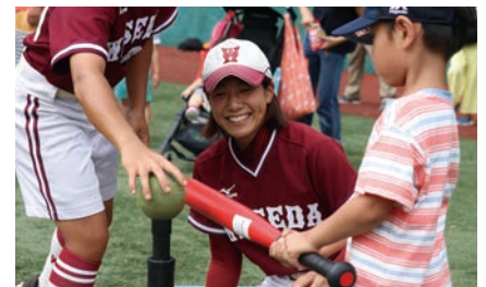
ティーボールバッティング！（ソフトボール部）