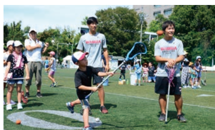
ラクロスを体験!ゴールを決めよう! (ラクロス部)