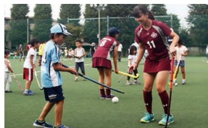
ウキウキ！ホッケー体験（ホッケー部）