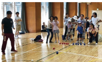
「ポッチャ」体験しようよ！（実施団体:ココスポ東伏見）