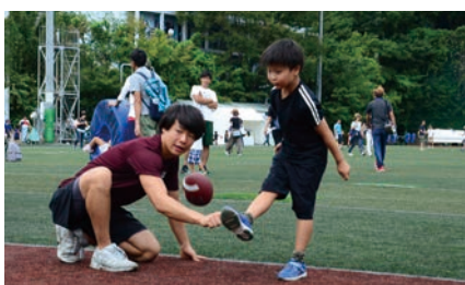
フラッグフットボール体験 (米式蹴球部)