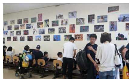
早稲田スポーツ新聞会写真展