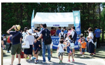
大塚製薬株式会社