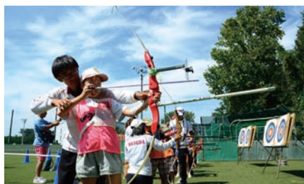
アーチェリー体験 (アーチェリー部)