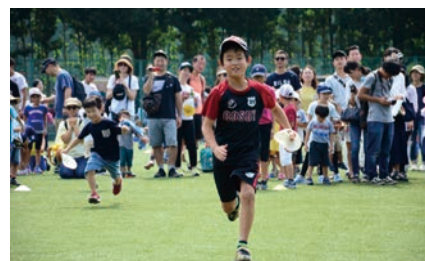
ちびっこリレー (競走部)