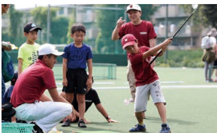
やってみよう!!ゴルフ体験！（ゴルフ部）