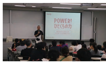
なるほどがいっぱい！みるく教室 （オリンピック・パラリンピック等経済界協議会）