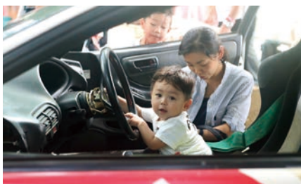
レースカー体験搭乗！（自動車部）