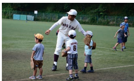
ちびっこ野球教室 (準硬式野球部)