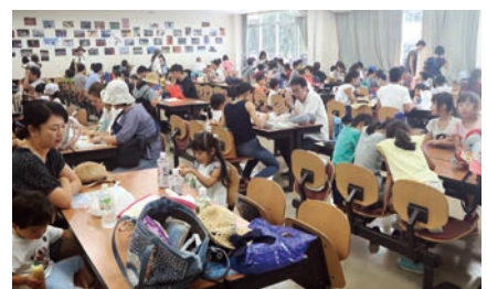
飲食・休憩スペース