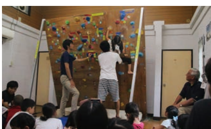
Let's climb!クライミング体験（山岳部）