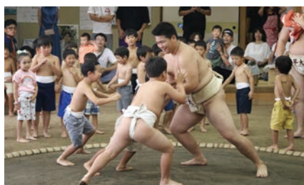
みんな集まれ！相撲教室！（相撲部）