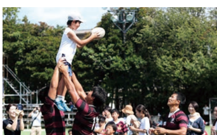
わくわく!ラグビー体験 (ラグビー蹴球部)