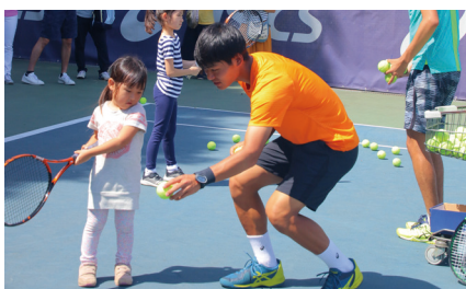
テニス教室 (硬式) (庭球部)