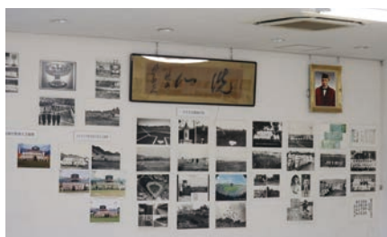
野球部展示「野球部の歴史」